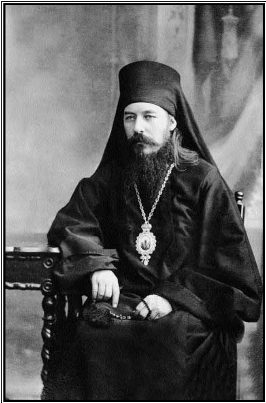
Амвросий, епископ Винницкий, викарий Каменец-Подольской епархии. 1920 год